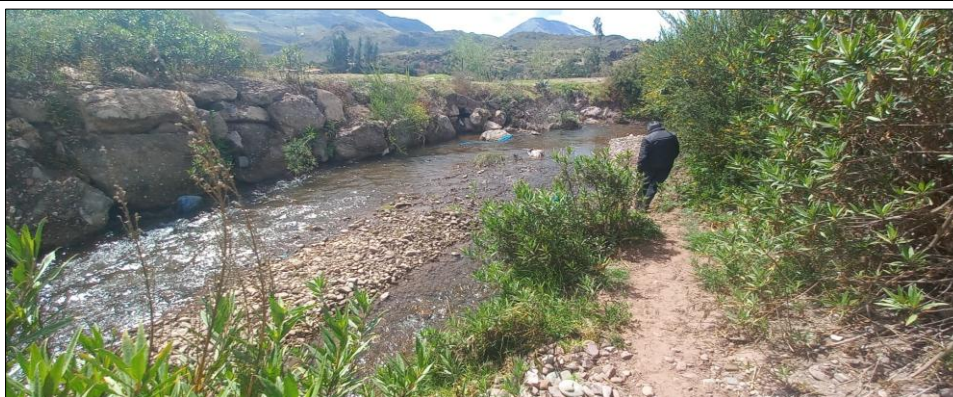
FIGURA N°01: TRAMO CRÍTICO EN EL RÍO LUCRE, DISTRITO DE LUCRE, PROVINCIA DE QUISPICANCHI - CUSCO, SE APRECIA TRAMO DE ENROCADO EN LA MARGEN DERECHA.