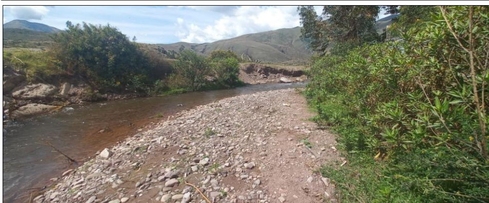
FIGURA N°01: TRAMO CRÍTICO EN EL RÍO LUCRE, DISTRITO DE LUCRE, PROVINCIA DE QUISPICANCHI - CUSCO, SE APRECIA CAUCE COLMATADO